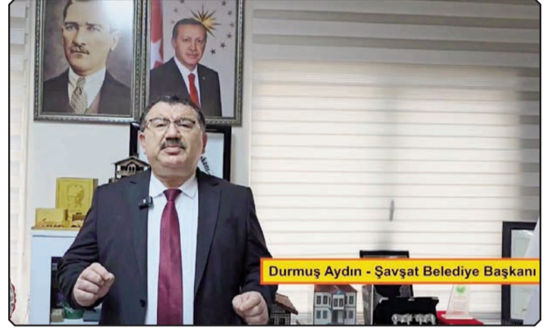
Durmuş Aydın - Şavşat Belediye Başkanı