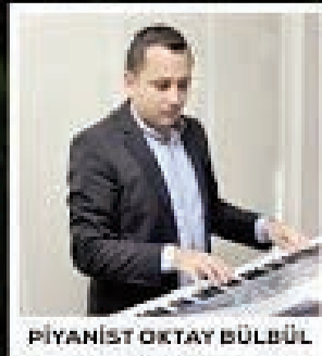
PIYANİST OKTAY BÜLBÜL