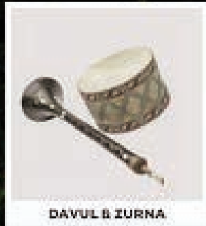
DAVUL & ZURNA