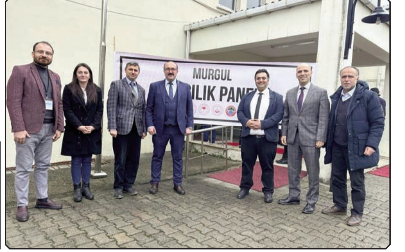
Haber: Arzu KÖR

sına ve sektörün sorunlarına ortak çözümler bulmasına olanak tanıyor. Sürdürülebilir kaliteli üretim için, üretimin en değerli parçası olan üreticilerimizle faaliyetlerimizde devam edeceğiz" dedi.