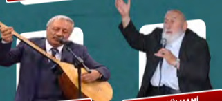
AŞIK ADANALI EYYÜBİ