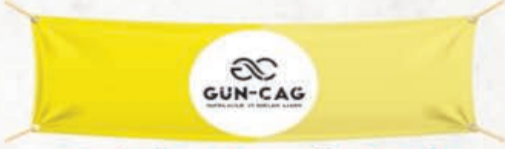
Tabela • Branda Baskı