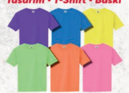
Tasarım • T-Shirt • Baskı