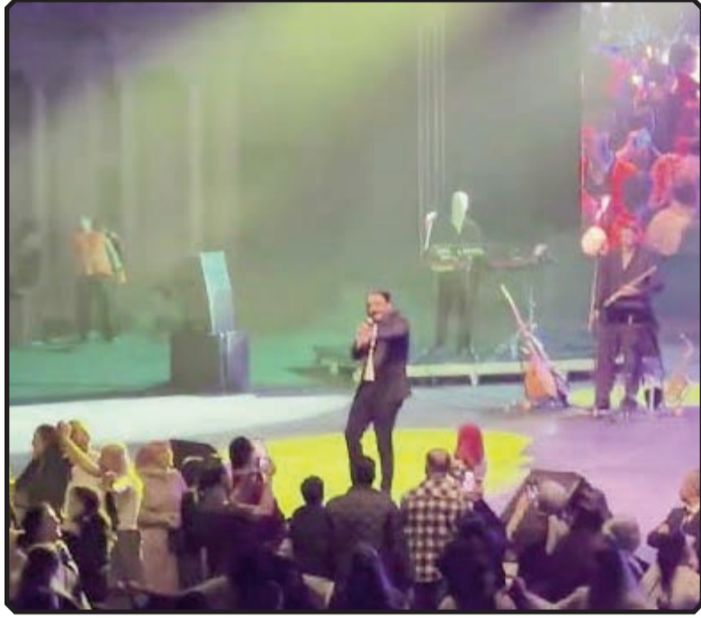
Haber: Arzu KÖR

Şavşat'ta son yıllarda artan ağaç kesimlerine de değinen Altun, "zararlı böcek" gerekçe- siyle başlatılan kesimlerin sağlıklı ormanları da kapsadığını söyledi. Geçmişte bölgede