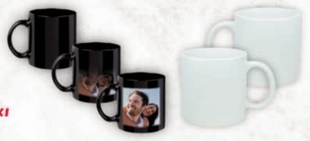
Tasarım • Bardak • Baskı