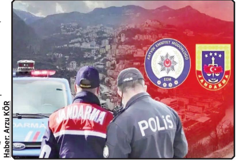
Haber: Arzu KÖR

Yetkililer, Artvin genelinde huzur ve güveniğin sağlanmasına yönelik çalışmaların aralıksız ve kararlılıkla sürdürüleceğini vurguladı. Yapılan açıklamada, suç ve suçlulara karşı mücadelenin aynı azimle devam edeceğinin altı çizildi.