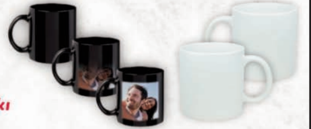
Tasarım • Bardak • Baskı