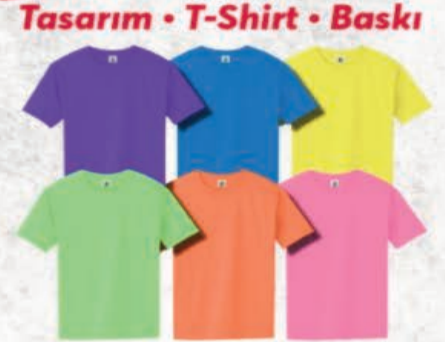
Tasarım • T-Shirt • Baskı