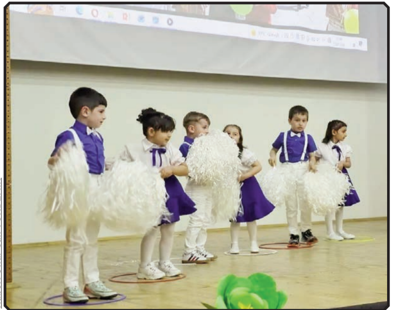
Haber: Onur Can TOKDEMİR

Etkinlikte ayrıca okulda yıl boyunca gerçekleştirilen faaliyetler slayt gösterimi eşliğinde katılımcılara sunuldu. Eğitim öğretim yılı boyunca yapılan sosyal etkinlikler, sınıf içi çalışmalar ve öğrencilerin katıldığı faaliyetlerden oluşan görüntüler veliler tarafından